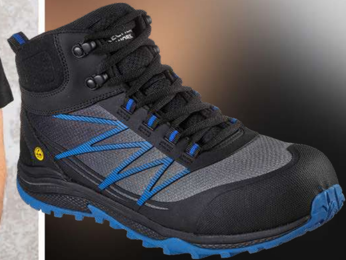
REF. 200047EC PUXAL FIRMLE