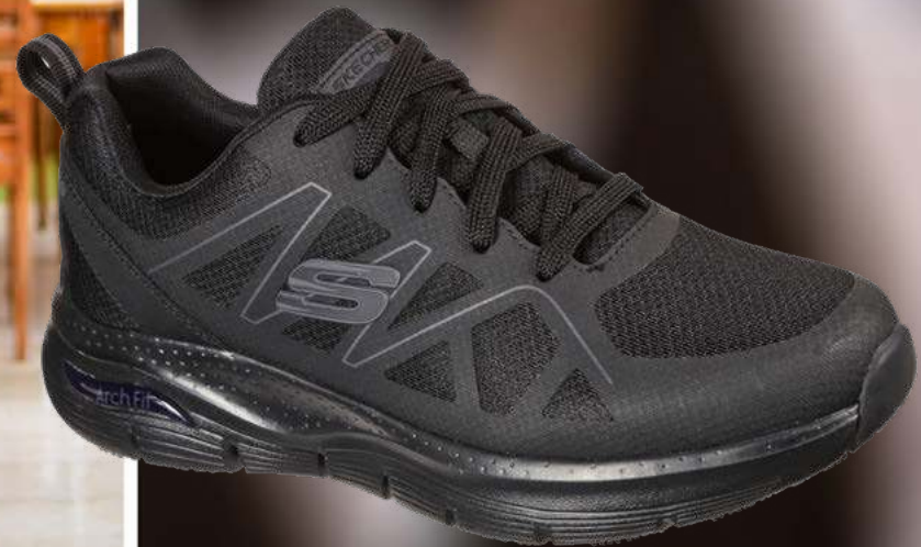
REF. SK200025EC ARCH FIT SR - AXTELL