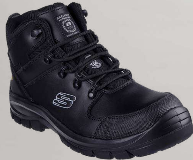
REF. SK200187EC TROPHUS - PENDING