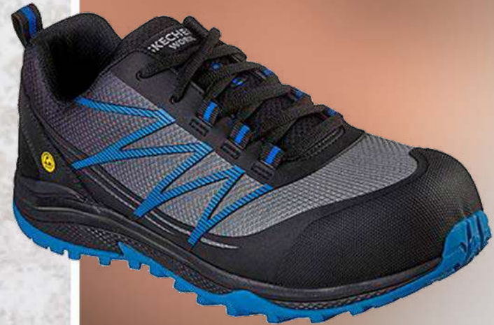
REF. SK200046EC PUXAL COMP TOE