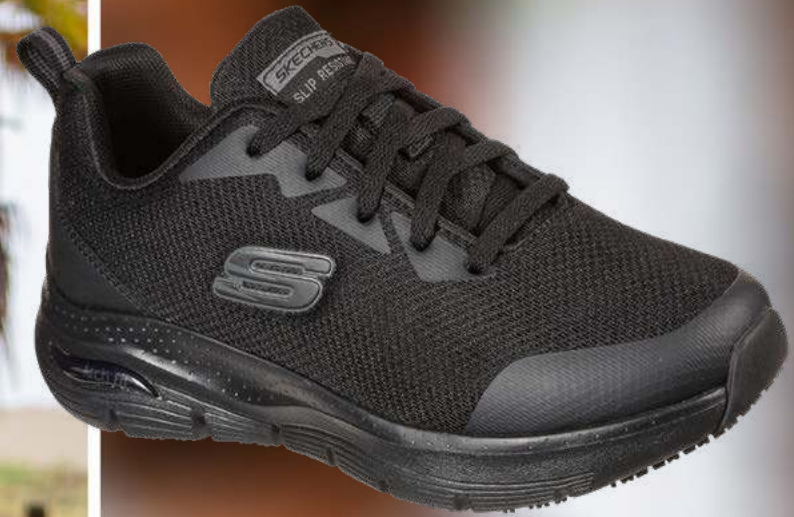
REF. SK108019EC ARCH FIT SR