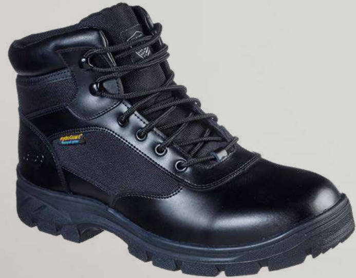
REF. SK77526EC WASCANA - BENEN WP